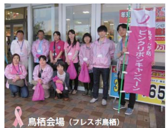
鳥栖会場 (プレスボ鳥栖)