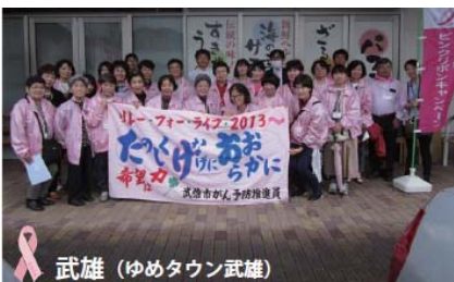
武雄 (ゆめタウン武雄)

【日程】 5月12日(日) 【会場】 県内5ヶ所の商業施設(佐賀、鳥栖、武雄、伊万里、唐津) ※集合時間・場所については、来月のさがんだより新聞でお知らせいたします